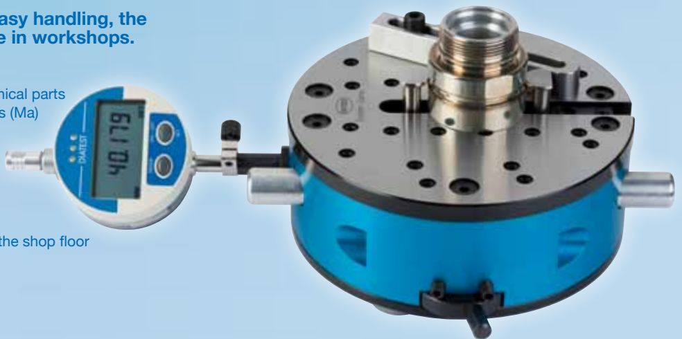
DIATEST DIA-COME C2